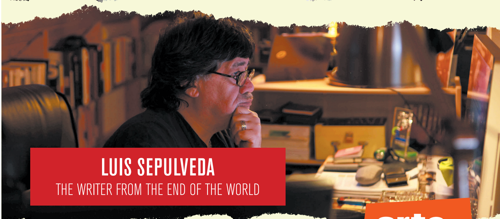
LUIS SEPULVEDA THE WRITER FROM THE END OF THE WORLD